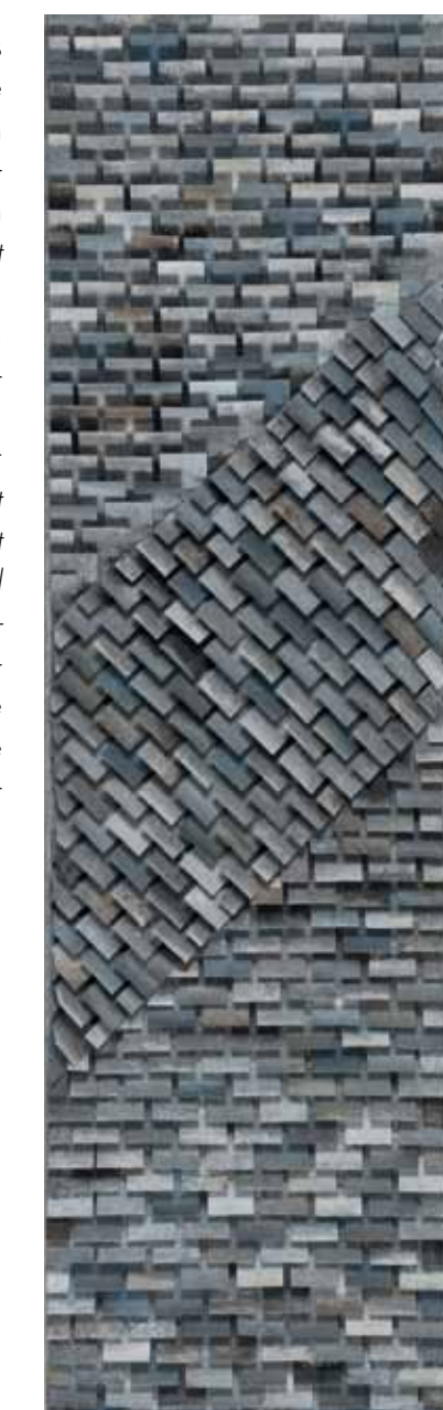
Cinétique, Pascal Catry

bleu Oxymore - Obscure clarté , réalisé à partir de 2000 plumes de canard sélectionnées pour leur rigidité et qualités graphiques. Artisan plumassière, elle s'attache à « faire de la plume autre chose que ce qu'on a en tête, à varier les supports au maximum en la remettant au goût du jour ». C'est l'apprentissage du métier de costumière qui lui ouvre les portes de ce monde au potentiel insoupçonné. Bol d'air entre deux commandes pour la mode ou le spectacle, elle exprime dans ses œuvres sa vision et sa sensibilité autour de cette matière, tout en soulignant n'avoir rien inventé : « Les aztèques réalisaient déjà des tableaux de plumes ». Teintes en noir, en hommage à l'œuvre Outrenoir de Pierre Soulages, les plumes sont transmutes, elles absorbent le regard pour mieux s'y perdre, car « le noir n'est jamais noir, il attrape la lumière et renvoie des reflets verts, violets, il devient émetteur de clarté, de lumière secrète ». Apprivoisée, comprise, sublimée, la plume, matière vivante par excellence, nous invite à nous laisser séduire par son pouvoir hypnotique.